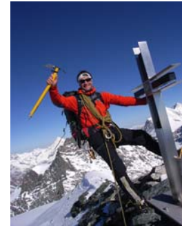
... und der Gipfel!