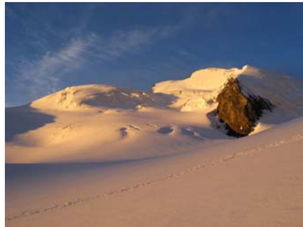
...erstes Sonnenlicht am Strahlhorn