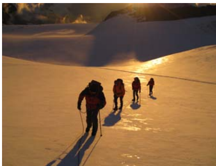
Sonnenaufgang am Allalingletscher...